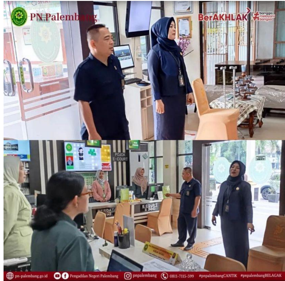
BRIEFING PETUGAS PTSP